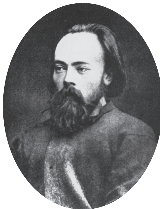
Рис. 1. Дмитрий Александрович Клеменц в 1875/76 гг.

Напряженная и активная жизнь оборвалась внезапно: в ночь на 25 февраля 1879 г. Д.А. Клеменц по доносу провокатора был арестован и заключен в Петропавловскую крепость, где в камере Трубецкого бастиона провел около 2,5 лет, после чего был сослан в Сибирь, в дале-