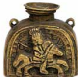
Лицевая и оборотная стороны