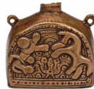
Чернильница Русские Европейская часть России. Вторая половина XVIII века Латунь; литье, чеканка, пайка 6,3 x 6 x 3,8 см Поступление: 1925, в составе коллекции, полученной в дар от Археологического отделения Ленинградского государственного университета РЭМ 4398-61

Чернильница арочной формы, с круглым горлом и двумя ушками. На фронтальных сторонах изображены рельефные фигуры льва и единорога. Зооморфные персонажи расположены по диагонали друг от друга, стоят на задних конечностях, передние подняты. Гривы переданы линиями и фестонами. Фон заполнен слегка углубленными растительным и геометрическим орнаментами. Орнаментальная композиция помещена в рамку, повторяющую арочный контур изделия и составленную из концентрических кругов. Между львом и единорогом размещено тюльпановидное растение. На торцевых сторонах – ряды из небольших окружностей, нанесенных на поверхность в технике чеканки.