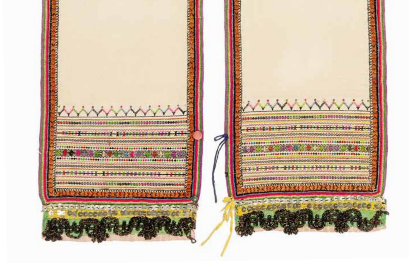
Женский праздничный головной убор. Фрагмент Марийцы Казанская губерния, Козьмодемьянский уезд, деревня Озерки. 1920-е годы Холст, хлопчатобумажные, шелковые и шерстяные нити, лента шелковая, сутаж, стекло, пайетки, позумент, пластмасса (пуговицы); ткачество, шитье, вышивание. 225 x 19,5 см Поступление: 1963, из экспедиционных сборов Т.А. Крюковой РЭМ 7476-15

зеркально симметрично относительно оси, проходящей через середину центрального узора. Сверху и снизу от центральной части узора проходят симметричные узкие полосы вышивки в виде повторяющихся знаков: ломаной линии; крючков, ориентированных влево; косых крестов; чередования косого креста и угла; разноцветных ромбов с роговидными отростками по срединам сторон. Полосы разных цветов симметричны относительно друг друга. Верхняя часть орнамента представлена лентой из семи фигур на одном конце и восьми на другом, выполненных в виде композиции из трех ромбов, на центральном из которых вышит прямой крест. Фигуры расположены на ломаной линии. На одном конце с лицевой стороны в центре узора привязана кисточка из шерстяных синих ниток, на другом конце – из розовых.