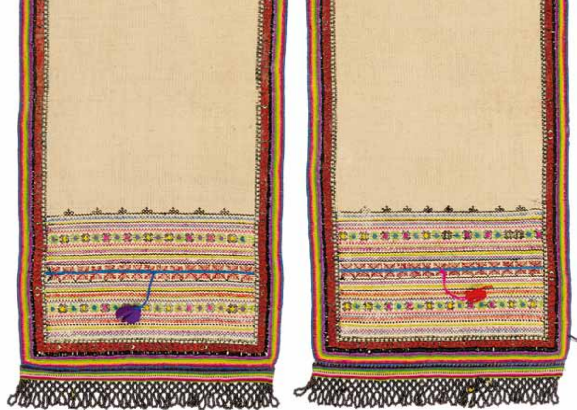
Женский праздничный головной убор. Фрагмент Марийцы Казанская губерния, Козьмодемьянский уезд. Конец XIX века Холст, шерстяные, шелковые и хлопчатобумажные нити, стеклярус; ткачество, шитье, вышивание 239 x 21 см Поступление: 1960, из экспедиционных сборов Т.А. Крюковой РЭМ 7287-13

Головной убор декорирован двусторонней вышивкой шелковыми, шерстяными и хлопчатобумажными нитями в техниках роспись, прямая счетная гладь, крест, петельный шов. На концах головного убора пришита декоративная домотканая тесьма, украшенная сеткой из черного бисера. Декор на концах головного убора идентичный. Орнамент вышивки геометрический, композиция ленточная. По периметру головного убора проходят 9 рядов обметочного шва и бордюры вышивки, в раппорте которого – вписанные ромбы. Контур узора выполнен черной шерстяной нитью, фон частично заполнен красной шелковой нитью. С внутреннего края бордюра – узкая полоса вышивки, составленная из повторяющихся вилкообразных фигур. На концах головного убора – основной орнамент: организация ритмическая, ориентация горизонтальная. В центре расположены две взаимно симметричные полосы из двух веток, исходящие из одной точки и направленные в стороны под углом 45 градусов. Вся композиция построена