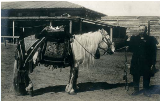
Фотоотпечаток: Мужчина с лошадью в праздничной упряжи. 1906 г. РЭМ 932-6

Для достижения поставленных задач был выполнен целый ряд работ. В первую очередь разработаны технические и технологические требования для обработки и оцифровки предметов музейного фонда, в том числе крупногабаритных предметов. Проведена оцифровка более 4000 единиц хранения музейных предметов из собрания Российского этнографического музея, которое насчитывает более 50 000 единиц хранения в целом.