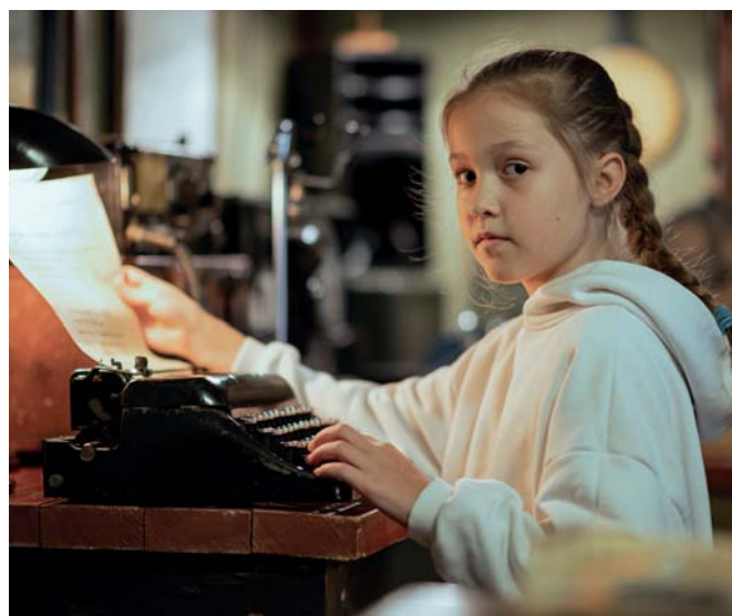
Участники детского клуба «Легенды Арктики» на выставке в интерьерах «Домика полярника»