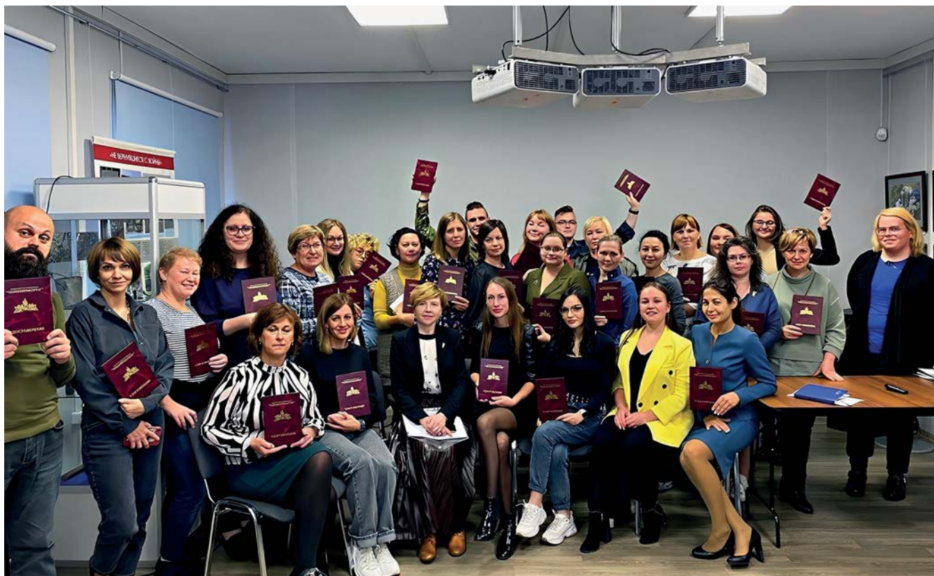
Участники курсов повышения квалификации в Мурманском областном краеведческом музее