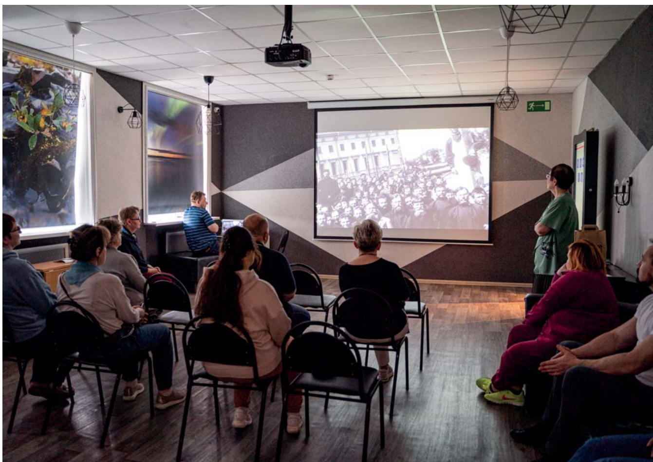
Встреча с жителями Певека