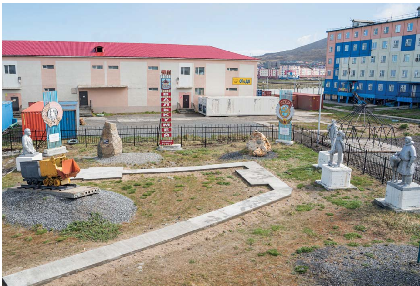
Тематический парк «Времен связующая нить» на территории Чаунского краеведческого музея, г. Певек