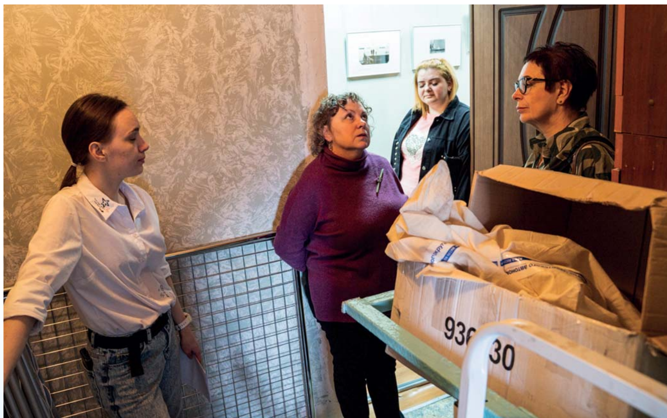
Экспертный визит в фондохранилище Чаунского краеведческого музея

сти фотографий (негативов и фотоотпечатков), системы учета, способов хранения и репрезентации в музейном и мультимедийном пространстве. В ходе посещения фондохранилищ смешанного типа хранения были даны рекомендации по необходимым мероприятиям для улучшения сохранности предметов, такие как варианты