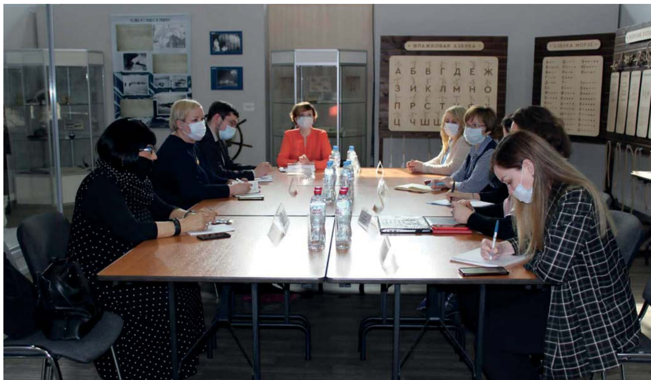
Участники совещания, Мурманский областной краеведческий музей, 21 апреля 2022 г.

21 апреля 2022 года, Мурманск. Состоялось второе рабочее заседание Секции арктических музеев Союза музеев России на базе Мурманского областного краеведческого музея. Участники встречи рассмотрели реализацию комплексного проекта по изучению, сохранению и популяризации исторического и культурного наследия Арктики на территории Мурманской области.