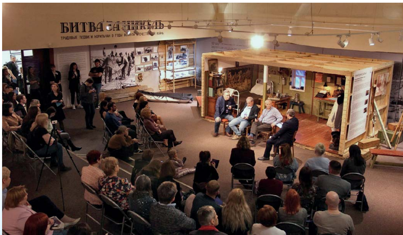
Выставка «Территория смелых» стала площадкой для мероприятий музея Норильска