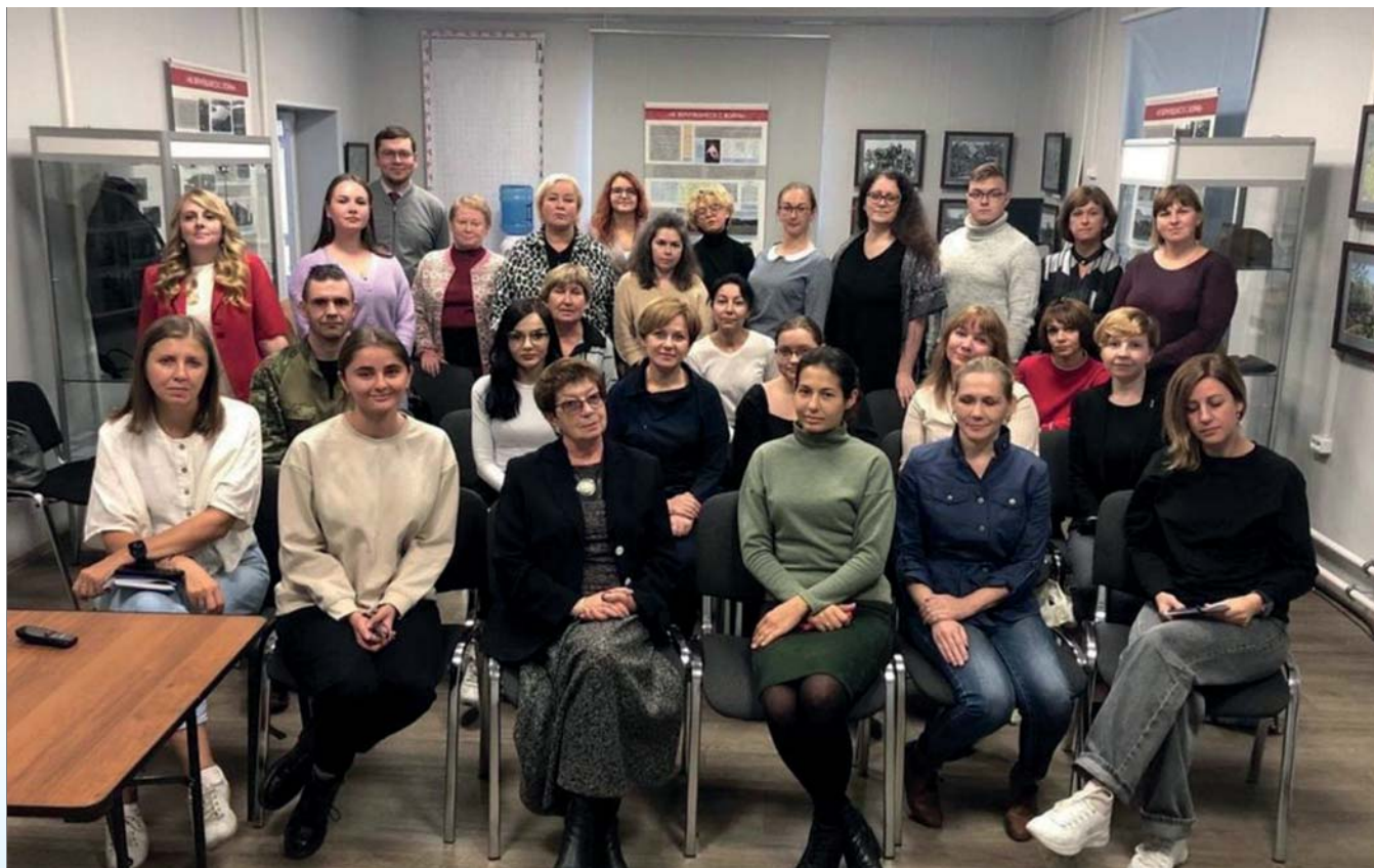
Участники курсов повышения квалификации в Мурманском областном краеведческом музее