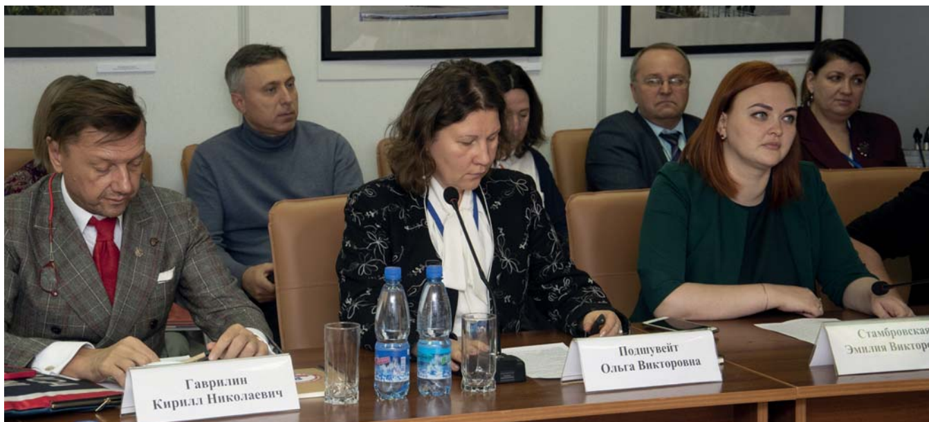
Участники Заседания Секции арктических музеев Союза музеев России «Работа с посетителями в арктических музеях: традиции, проблемы и перспективы развития», Таймырский краеведческий музей, Дудинка, 7 октября 2022 г.

Участники определили общий круг проблем, обменялись опытом работы в различных форматах культурно-образовательной деятельности, опытом взаимодействия с посетителями разных возрастных категорий, обсудили особенности влияния различных внешних факторов на работу музея. Было отмечено, что за полярным кругом музеи играют более значимую роль в жизни людей, оставаясь хранителями культурного и исторического наследия Арктики. Важным выводом стало