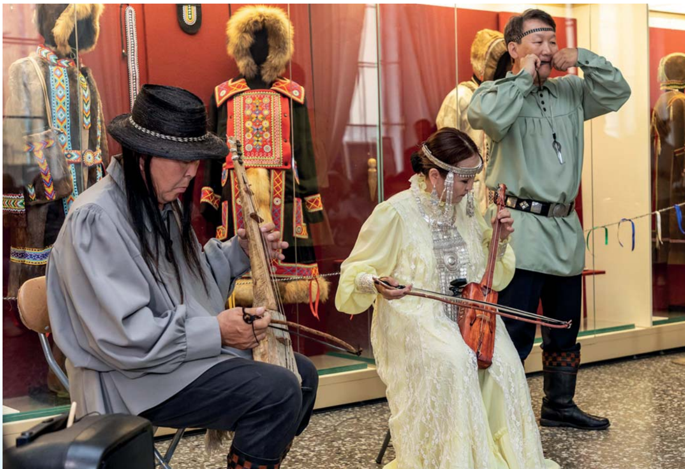
Ансамбль традиционной якутской музыки «Кыл Саха»

Выставка «Мотивы Севера» раскрыла перед гостями Российского этнографического музея материальную и духовную культуру коренных народов Якутии: якутов, эвенов, эвенков, чукчей, юкаги-