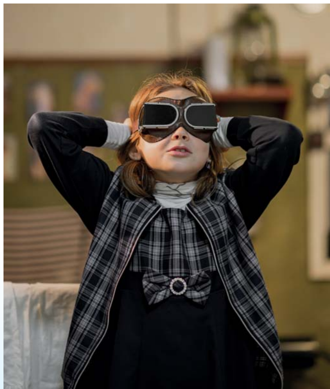
Участники детского клуба «Легенды Арктики» на выставке в интерьерах «Домика полярника»