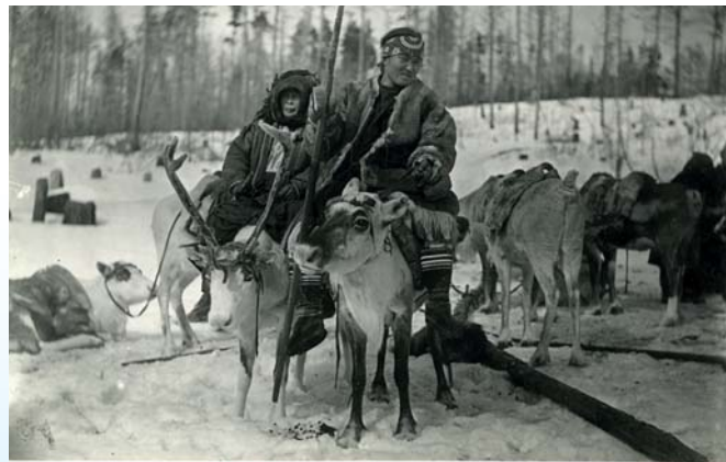
Фотоотпечаток: Способ езды верхом на оленях. Эвенки: эвенки (эвенки западные). 1907–1908 гг. РЭМ 5659-42