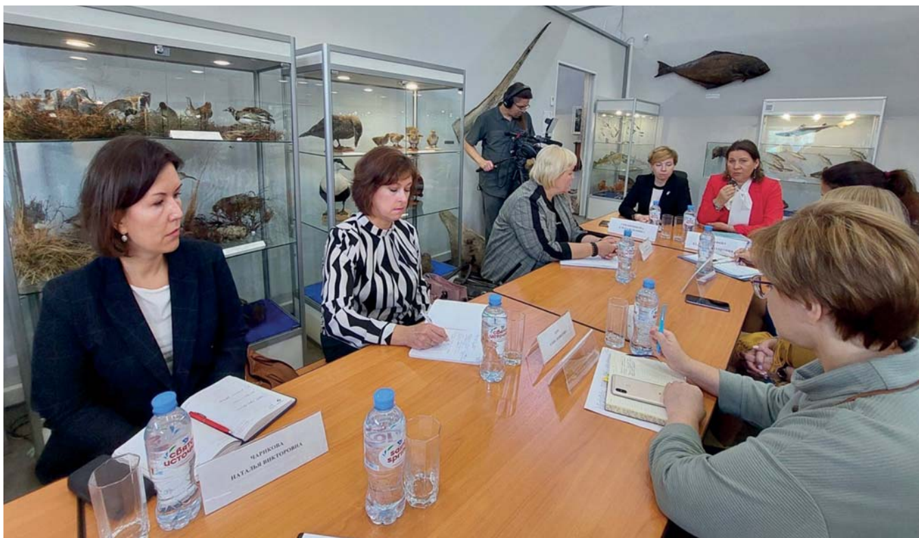
Участники совещания, Мурманский областной краеведческий музей, 9 сентября 2022 г.

сийского проекта Министерства культуры Российской Федерации «Музейные маршруты России» и сформулировали главную тему заседания — «Арктические музеи как фактор экономического развития Арктической зоны России».