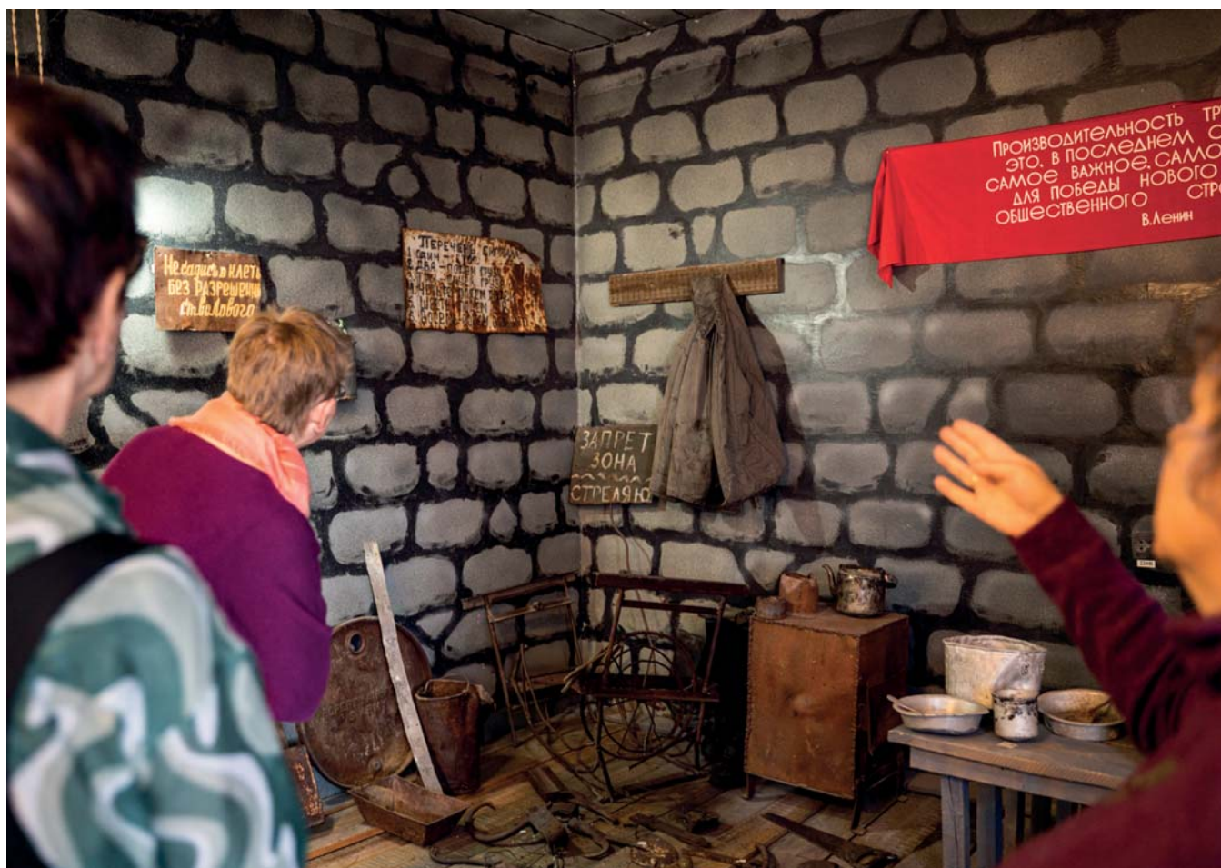
Осмотр экспозиции «Чаун — Чукотка за колючей проволокой» Чаунского краеведческого музея

боты. Также в ходе дискуссии говорили о социальной защищенности коренных жителей — со стороны так называемых «богатых» предприятий оказывается недостаточная поддержка местных жителей. Этот тезис вызвал неоднозначную реакцию, так как поддержка оказывается, но имеет адресный и целевой характер.