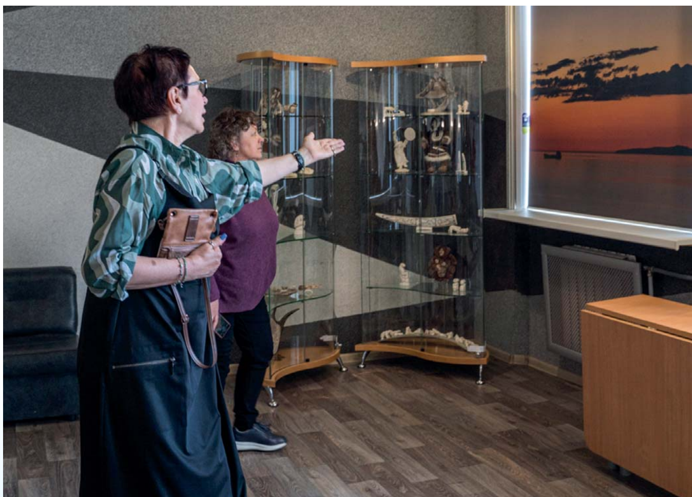
Экспертный визит на экспозицию «Зал естественной природы» Чаунского краеведческого музея

Одним из важных событий для сотрудников Российского этнографического музея оказалась встреча с коллективом фольклорного ансамбля «Эйнэткун». Разговор с участниками коллектива о развитии и сохранении уникального нематериального культурного наследия коренных жителей Чукотки явился некоторым откровением по глубине обсуждения затронутых вопросов и пониманию важности работы с детьми и молодежью для сохранения чукотского языка, фольклора, основ традиционной культуры. Проблемы сохранения нематериального наследия на Чукотке не могут не волновать коренных и малочисленных жителей региона. Прежде всего, это незнание чукотского языка и, как следствие этого незнания, слабый интерес к историческим и этнографическим корням. На сегодняшний день очень малое количество коренных жителей, особенно молодежи, проявляет интерес к традиционным формам хозяйствования — оленеводству и морзвербойному промыслу, возможно, из-за низкой заработной платы и сложных условий ра-