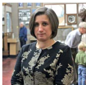
Наталья Петрова, директор Российского государственного Музея Арктики и Антарктики, Санкт-Петербург