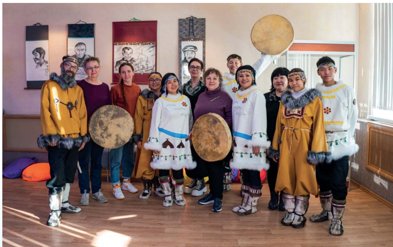
Встреча с коллективом фольклорного ансамбля «Эйнэткун»