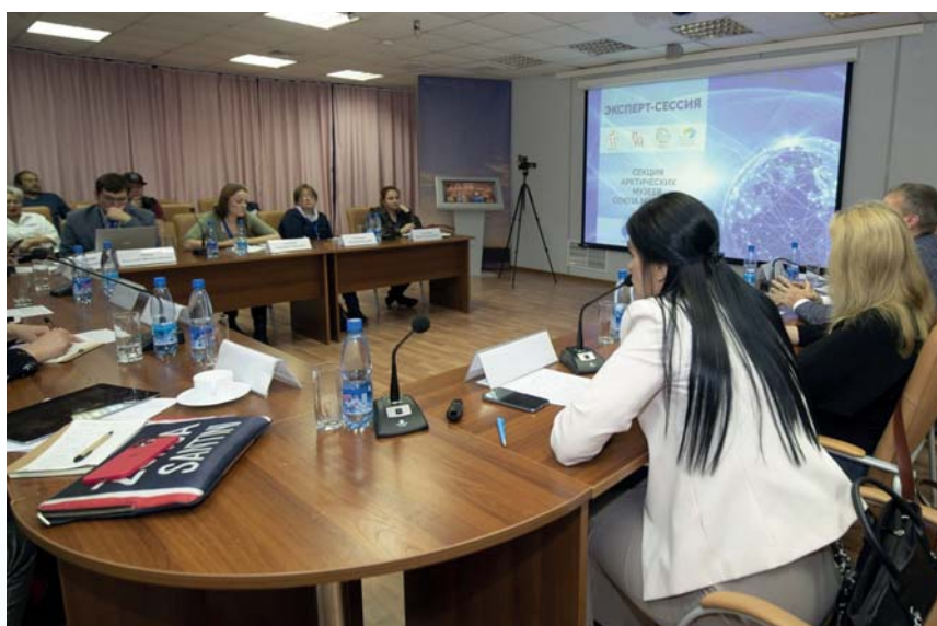
Заседание Секции арктических музеев Союза музеев России «Работа с посетителями в арктических музеях: традиции, проблемы и перспективы развития», Таймырский краеведческий музей, Дудинка, 7 октября 2022 г.