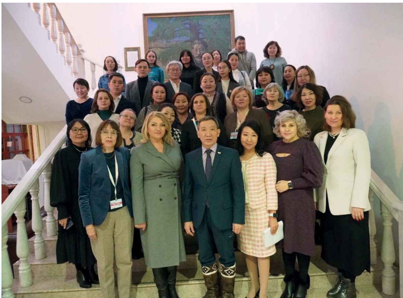
Участники стратегической сессии «Роль музеев в развитии и популяризации арктических регионов»

коллаборации: «Мы не боимся ошибаться! Мы умеем слушать друг друга! Мы готовы поддерживать друг друга в любой ситуации сложного и нестабильного времени стремительных перемен. Вместе мы — самая мощная созидательная энергия Арктики».