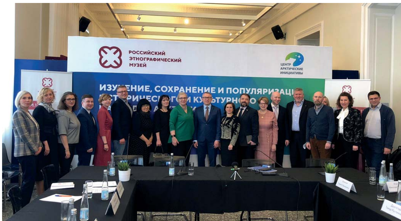
Участники круглого стола «Развитие сетевого партнерства в Арктике на примере межмузейных проектов»

ничества Арктического региона по линии музейного сообщества.