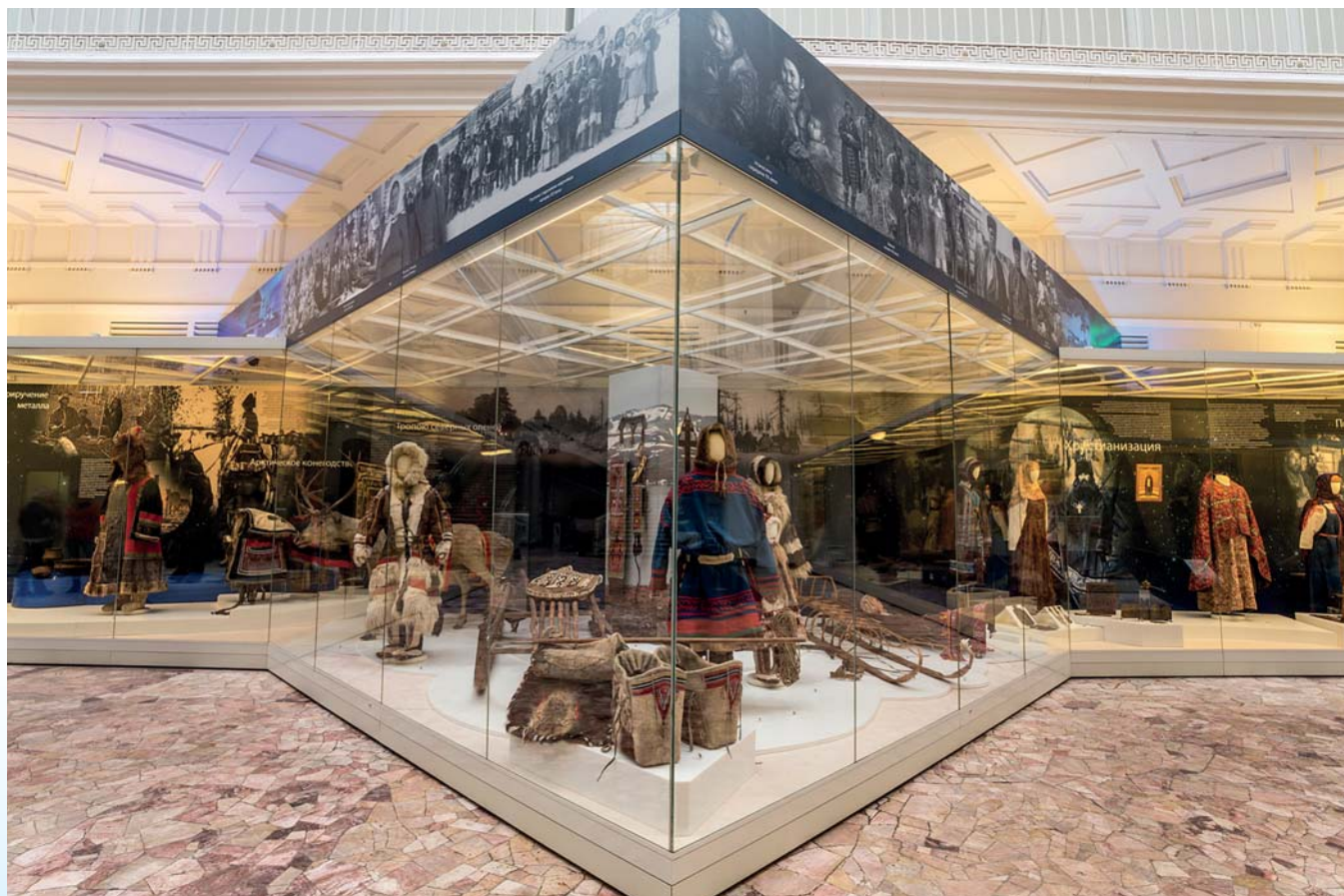
Временная выставка «Арктика — Земля обитаемая», Российский этнографический музей

Работая над созданием постоянной экспозиции, руководители Проекта ставят перед собой главную цель — содействовать формированию интереса к истории и культуре коренных народов российского Севера, Сибири и Дальнего Востока у широкой публики, что обеспечит сохранение и передачу будущим поколениям культурного наследия Арктики. Для этого необходимо представить наиболее ценные собрания Российского этнографического музея по культуре коренных народов российского Севера, Сибири и Дальнего