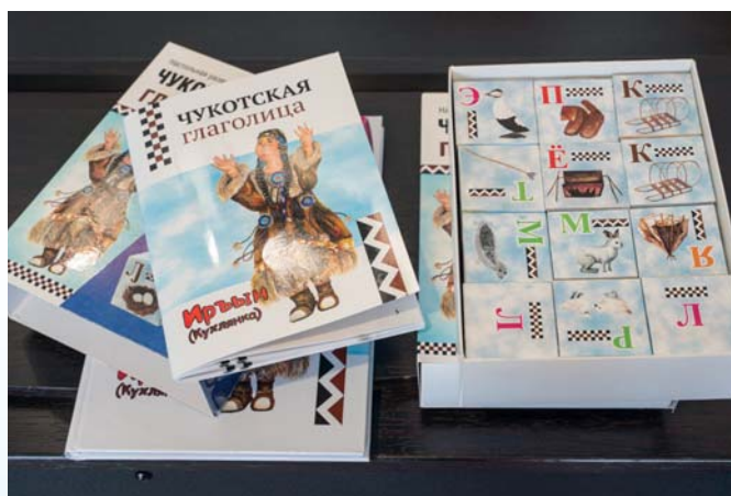
Материалы проекта по сохранению чукотского языка «Чукотская глаголица»

В музее начали использовать рекомендации в учетно-хранительском и фондовом направлениях после проведенных мероприятий, подготовленных Российским этнографическим музеем.