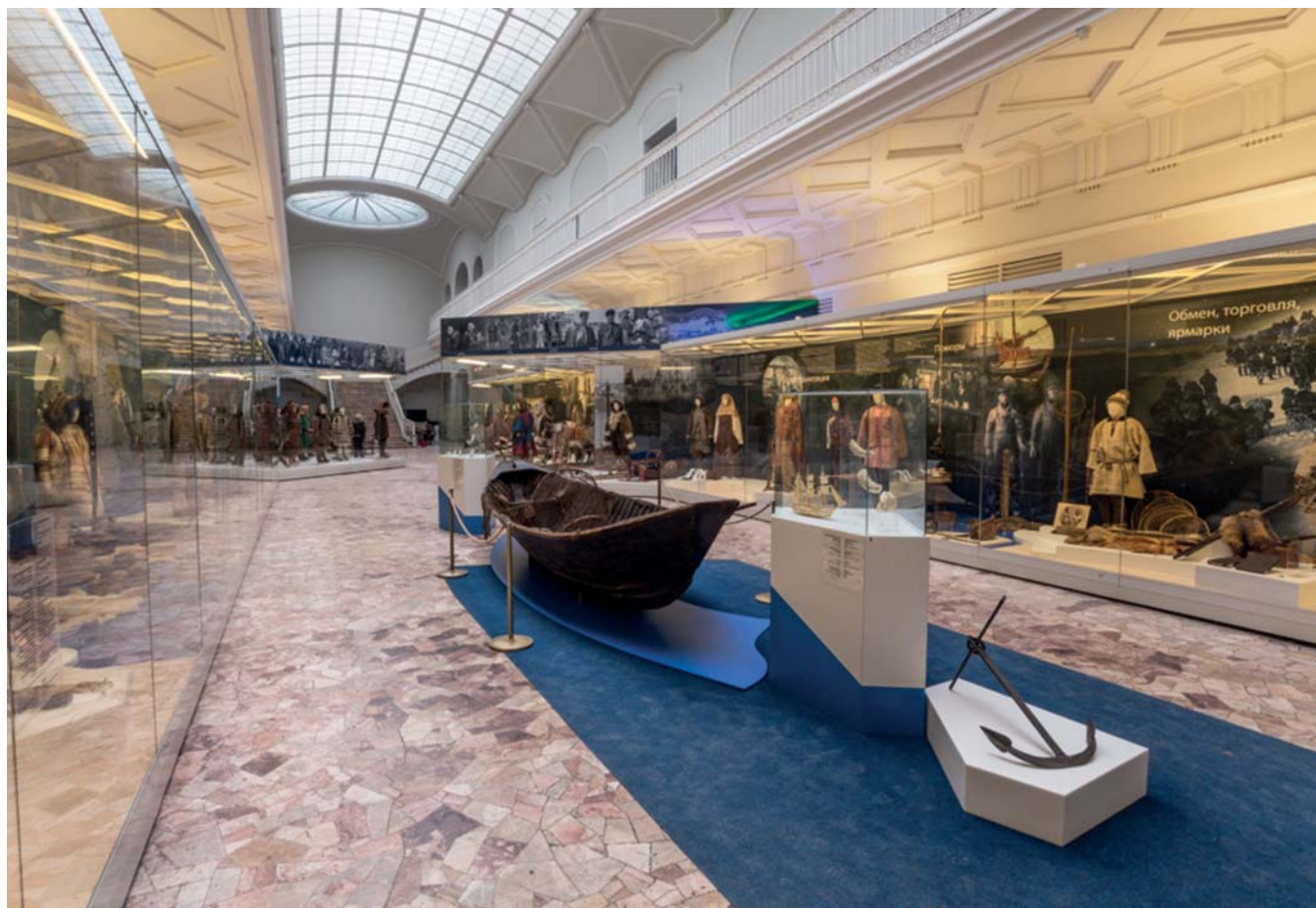
Временная выставка «Арктика — Земля обитаемая», Российский этнографический музей

Востока в актуальных для современных посетителей форматах. Новая экспозиция должна быть доступна разным возрастным категориям посетителей, сочетать зрелищность и интерактивность, быть информационно-познавательной и развлекательной, предусматривать возможности разнообразного поведения посетителей.