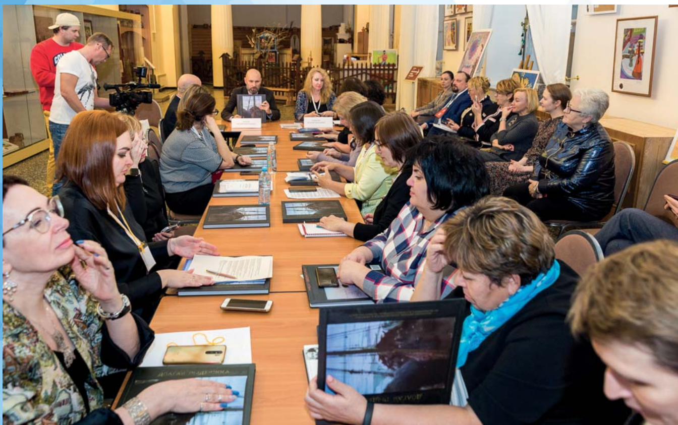
Итоговое заседание Секции арктических музеев Союза музеев России, Российский этнографический музей, Санкт-Петербург, 9 ноября 2022 г.