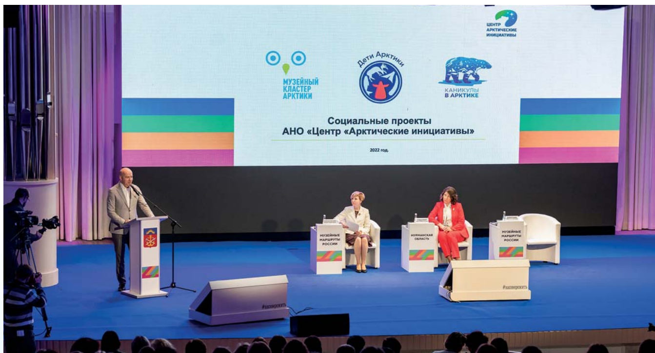
Заседание Секции арктических музеев Союза музеев России в рамках Всероссийского проекта Министерства культуры Российской Федерации «Музейные маршруты России», Мурманск, 12 октября 2022 г.

12 октября 2022 года, Мурманск. В рамках Всероссийского проекта Министерства культуры Российской Федерации «Музейные маршруты России» состоялось пятое заседание Секции арктических музеев Союза музеев России.