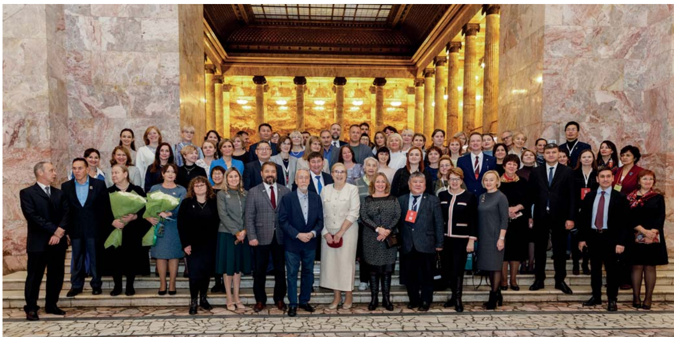
Участники Торжественного заседания, посвященного 120-летию юбилею Российского этнографического музея

8–9 ноября 2022 года, Санкт-Петербург. Итоговое заседание Секции арктических музеев Союза музеев России в рамках юбилейных мероприятий Российского этнографического музея, посвященных 120-летию со дня основания.