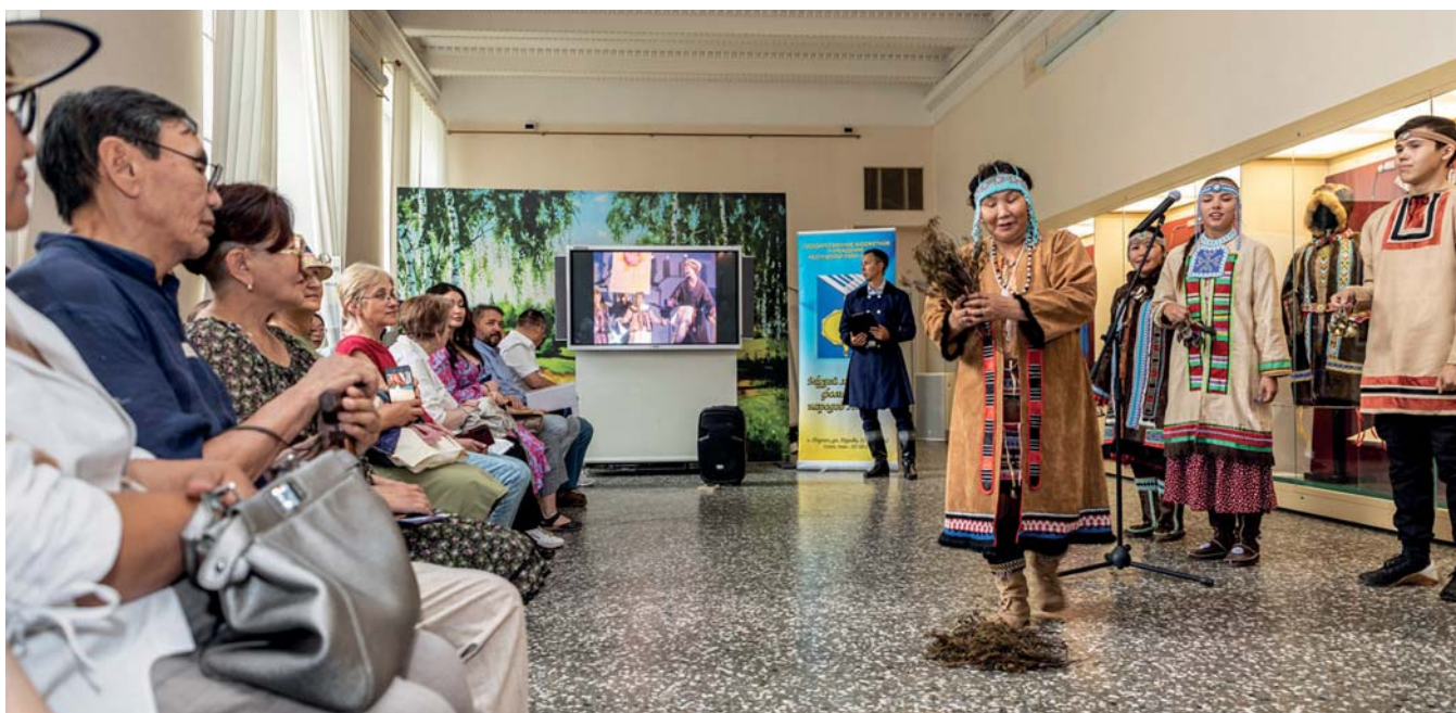
Медиация «Эвенкийский обряд очищения и благословения»

ров, долган, русских арктических старожил. На выставке были представлены традиционные костюмы коренных народов Якутии, сшитые руками современных мастеров, шаманские костюмы и атрибуты, идолы, музыкальные инструменты, игрушки.