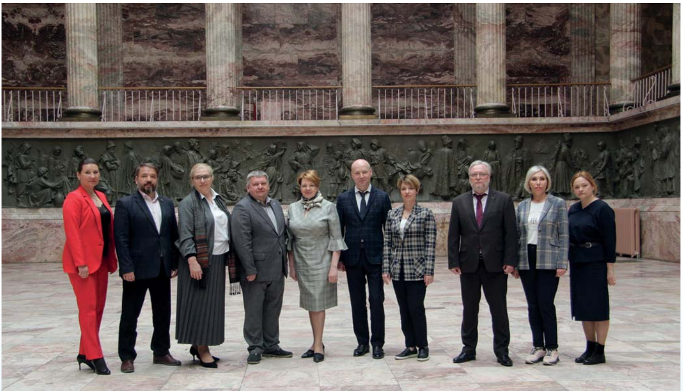
Участники рабочего совещания с представителями арктических регионов в Санкт-Петербурге, 12 мая 2022 года

В связи с отсутствием возможности международного гуманитарного взаимодействия в рамках Арктического совета Министерства иностранных дел России инициировало и поддерживает развитие межрегионального культурного сотруд-