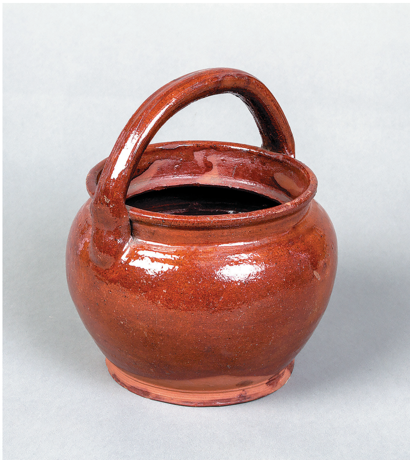
Сосуд для переноски пищи, 1930-е гг.