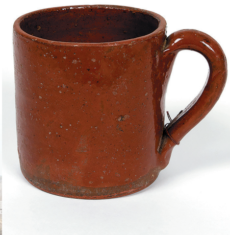
Кружка, первая треть XX века