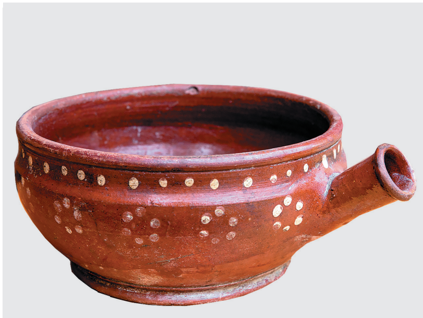
Сосуд для кваса, браги с традиционной оятской росписью, начало XX века