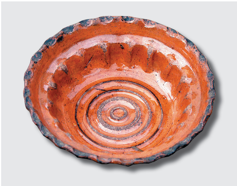
Латка для киселя, начало XX века