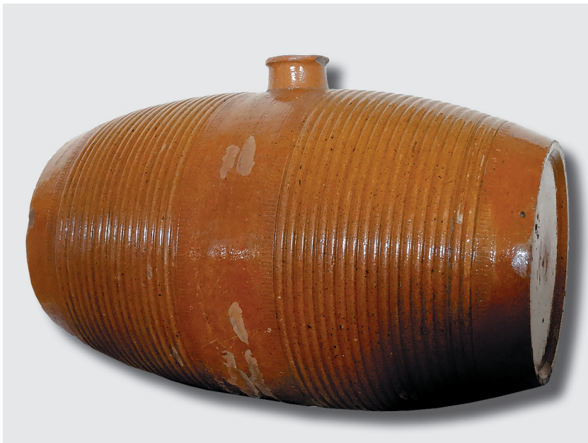
Бочонок для пива, первая треть XX века