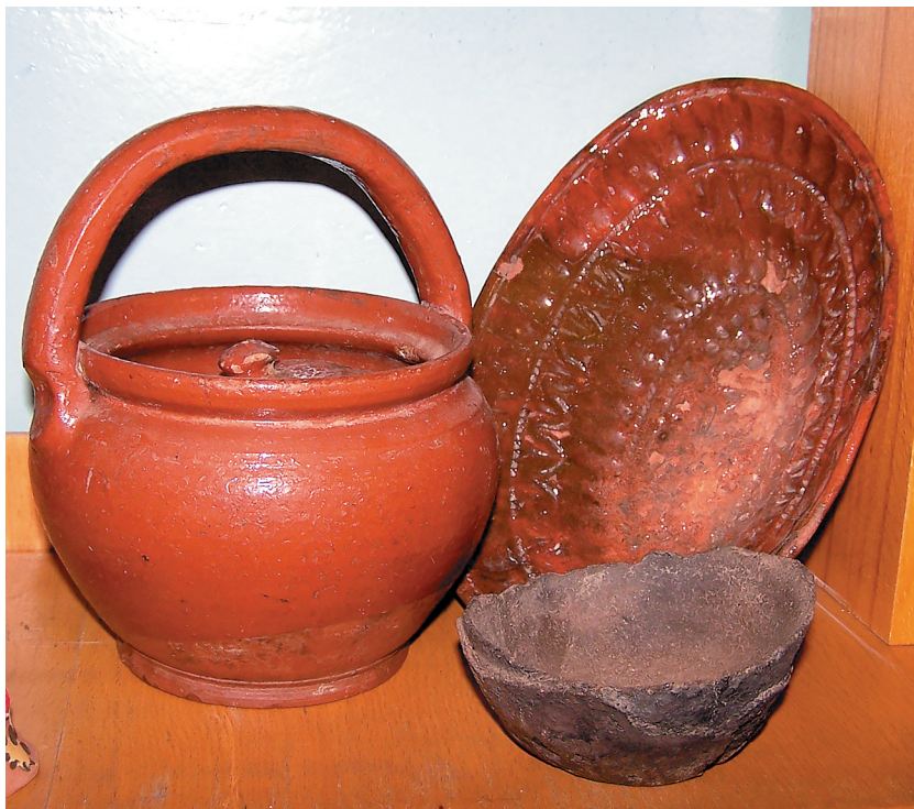
Оятская керамика, первая треть XX века