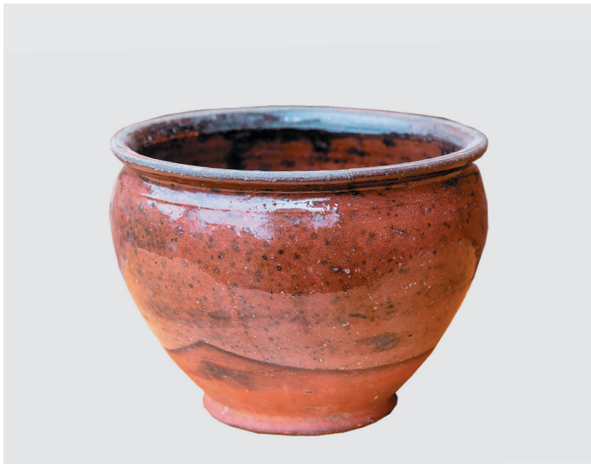
Горшок для приготовления пищи в печи, 1920-е гг.