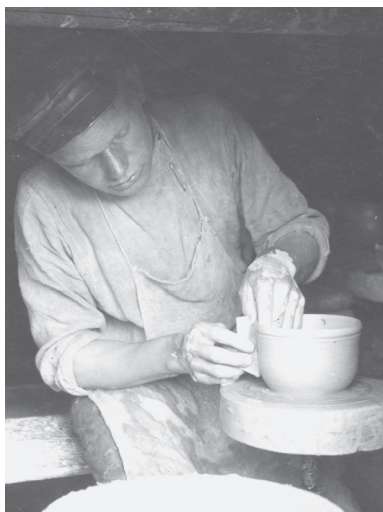
Гончар за работой. д. Надпорожье

орнаментом чаще всего украшали стенки мисок. Спирали наносили на тулово кувшинов, а «розетки» и «звездочки» на сосуды, предназначенные для пива и кваса. Иногда роспись дополнялась штрихованным орнаментом, который выполнялся зубчатым колесиком. Края посуды, предназначавшейся для продажи в город, украшали «борочками» – фестонами. Свистульки лепили вручную. Секреты мастерства, как и прежде, хранились в тайне. После революции на Ояти можно было еще встретить гончаров, которые из поколения в поколение передавали свой семейный опыт изготовления глиняных изделий и не допускали чужих людей к своим гончарным кругам и обжигательным печам.