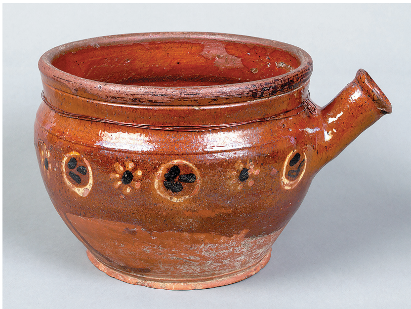
Сосуд для кваса, браги с традиционной оятской росписью, начало XX века