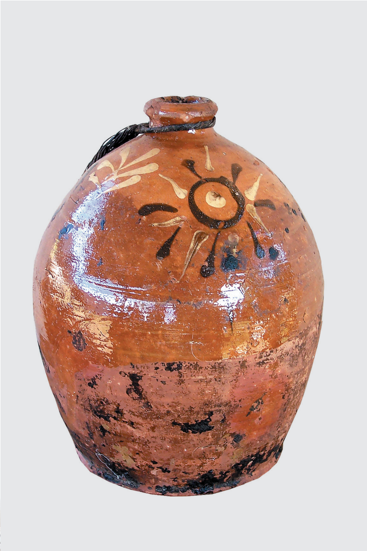
Сосуд для хранения масла с традиционной оятской росписью (впоследствии использовался для хранения дёгтя), начало XX века