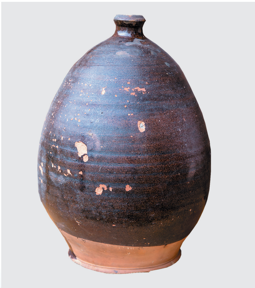
Сосуд для хранения масла, 1930-е гг.