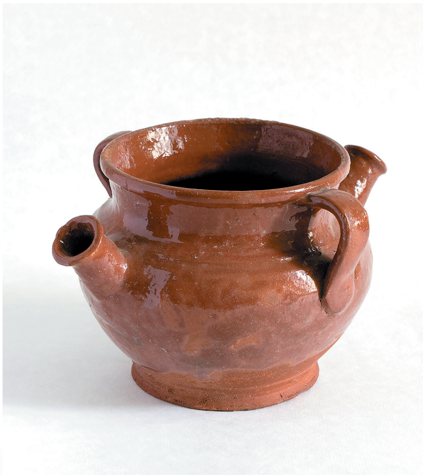
Рукомойник, 1930-е гг.