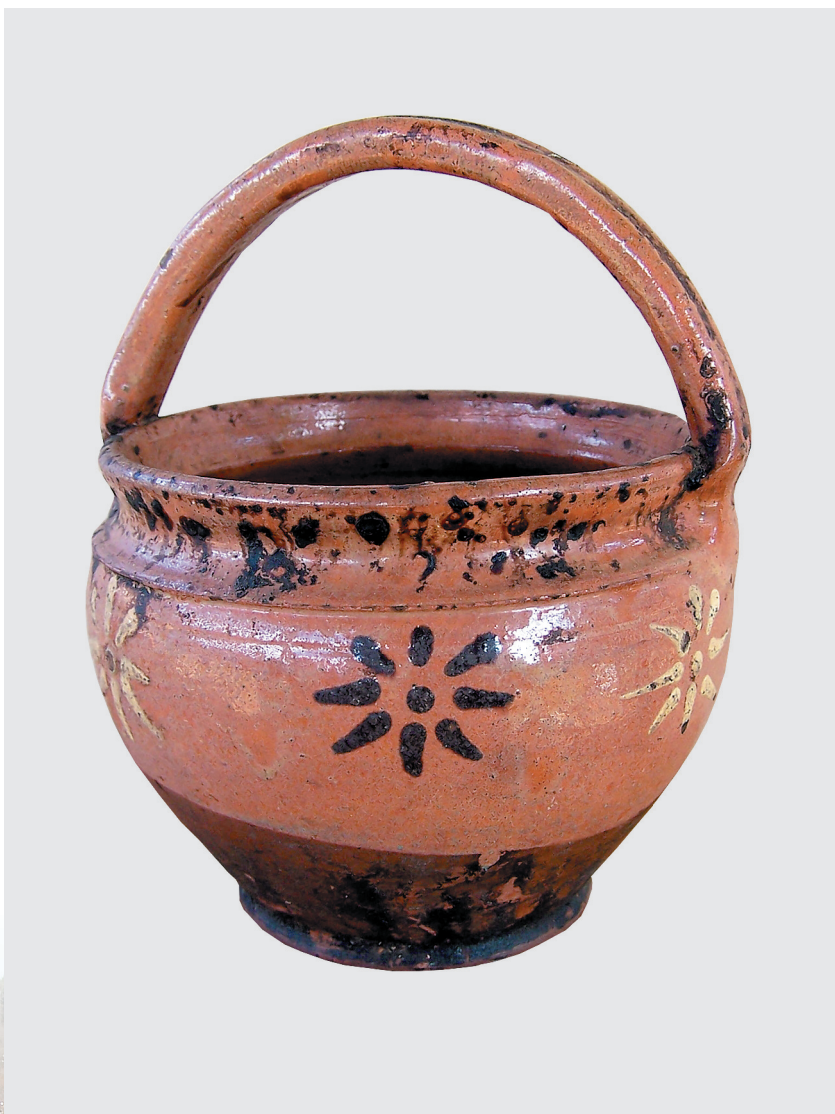
Сосуд для переноски тищи с традиционной оятской росписью, начало XX века