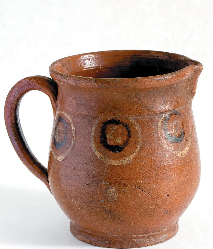
Кувшин для молока с традиционной оятской росписью, начало XX века