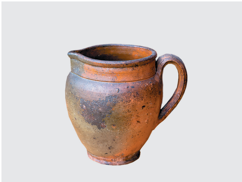
Кувшин для молока, первая треть XX века