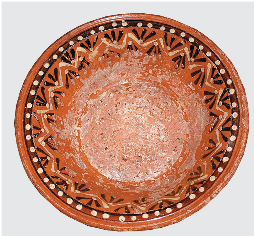
Миска с традиционной оятской росписью, начало XX века