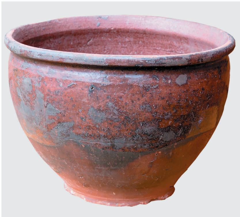
Горшок для приготовления теста, первая треть XX века