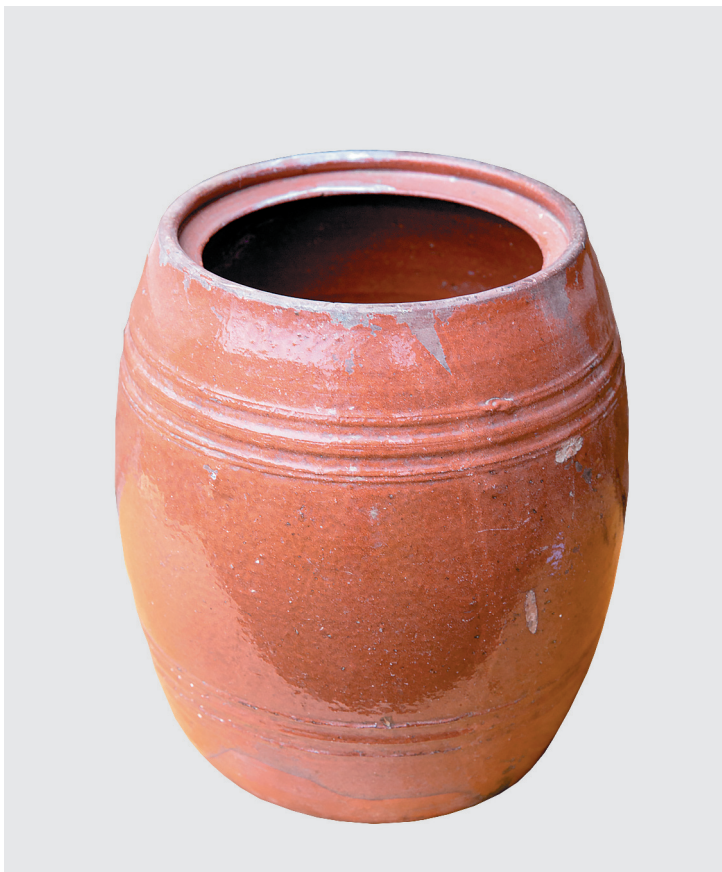
Бочонок для хранения масла, первая треть XX века