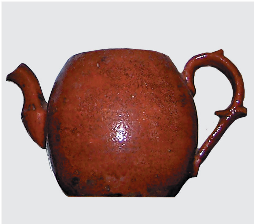
Чайник, начало XX века