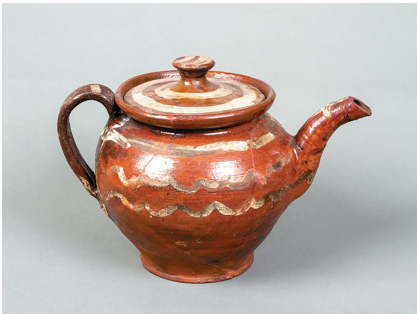
Чайник с традиционной оятской росписью, начало XX века