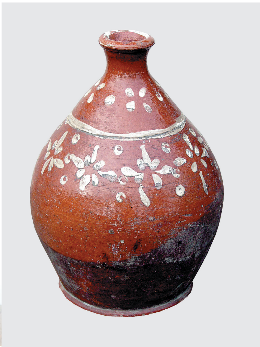
Сосуд для масла с традиционной оятской росписью, начало XX века