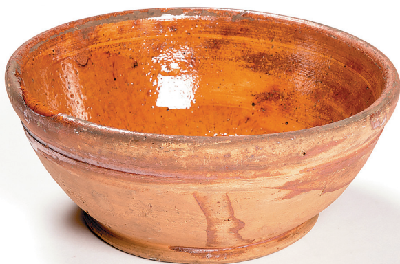
Миска, 1930-е гг.