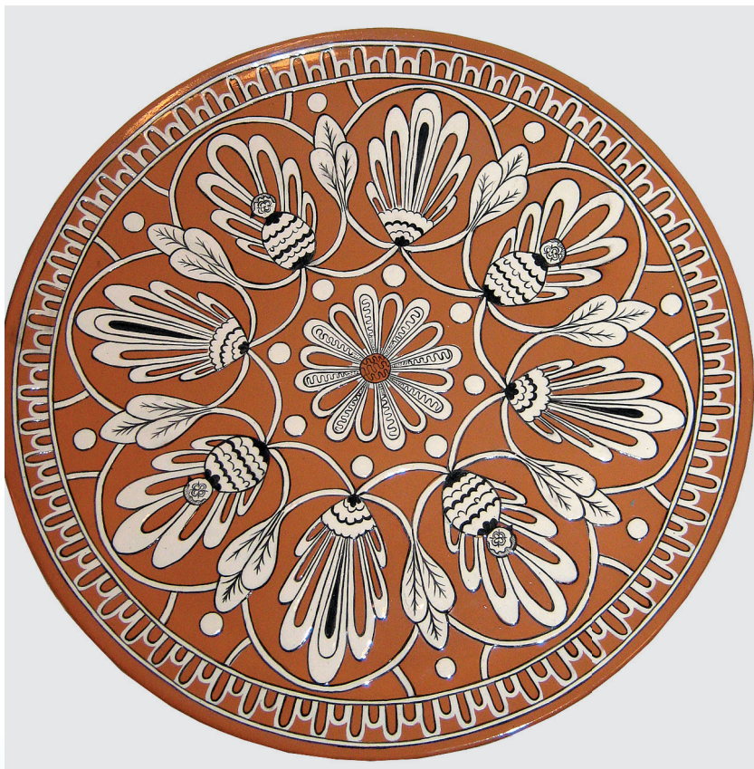
Блюдо, начало 1970-х гг.