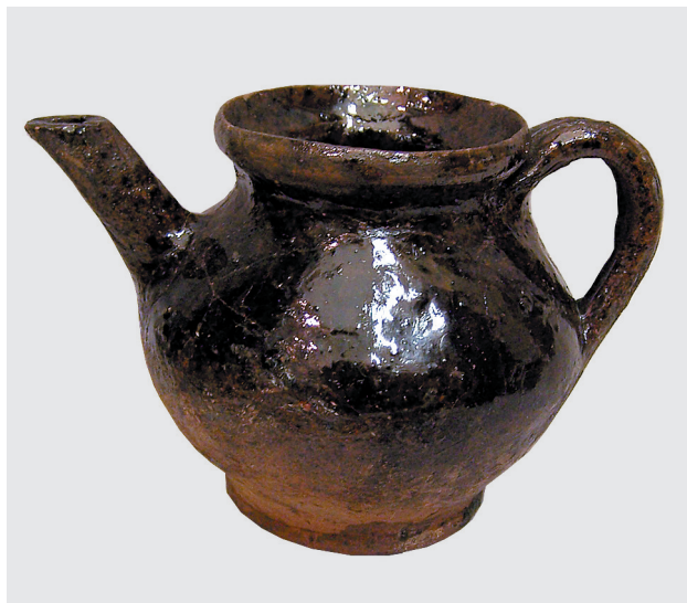
Чайник заварной, начало XX века