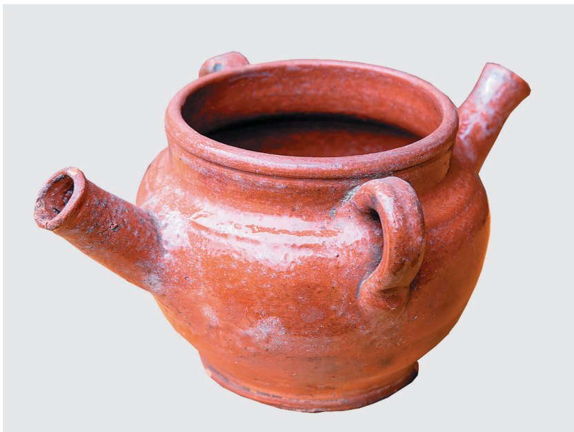
Рукомойник, первая треть XX века