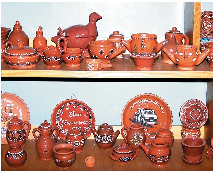
Оятская керамика, 2000-е гг. Музей с. Алёховщина