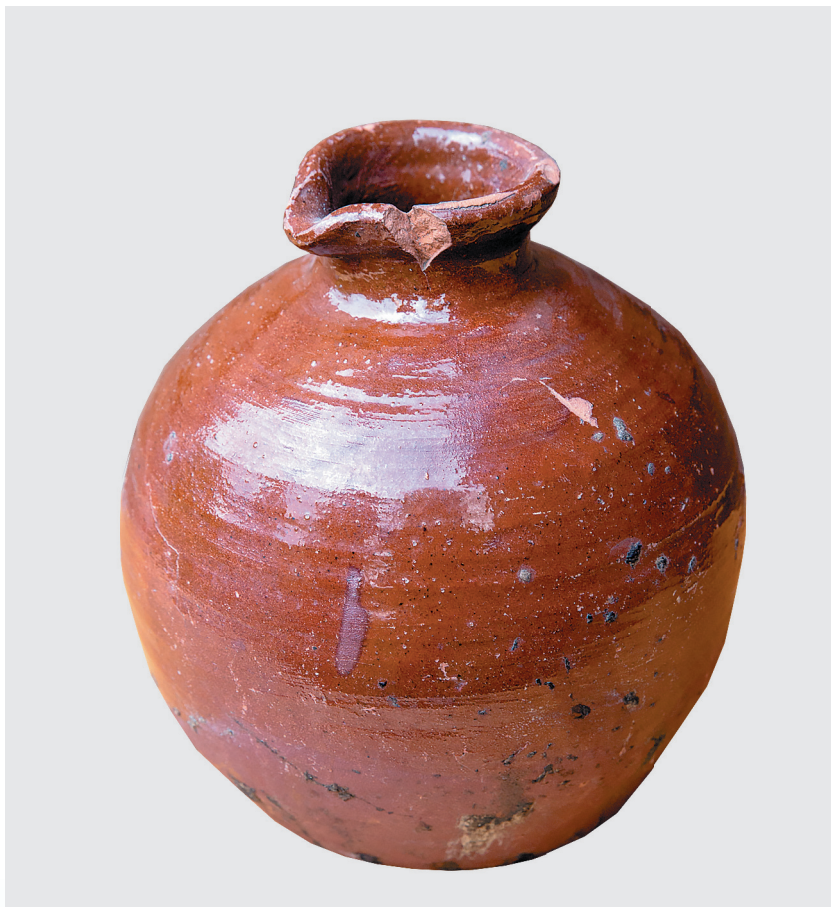
Сосуд для хранения жидкостей