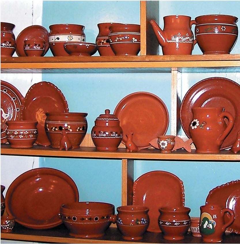
Оятская керамика, 2000-е гг. Музей с. Алёховщина