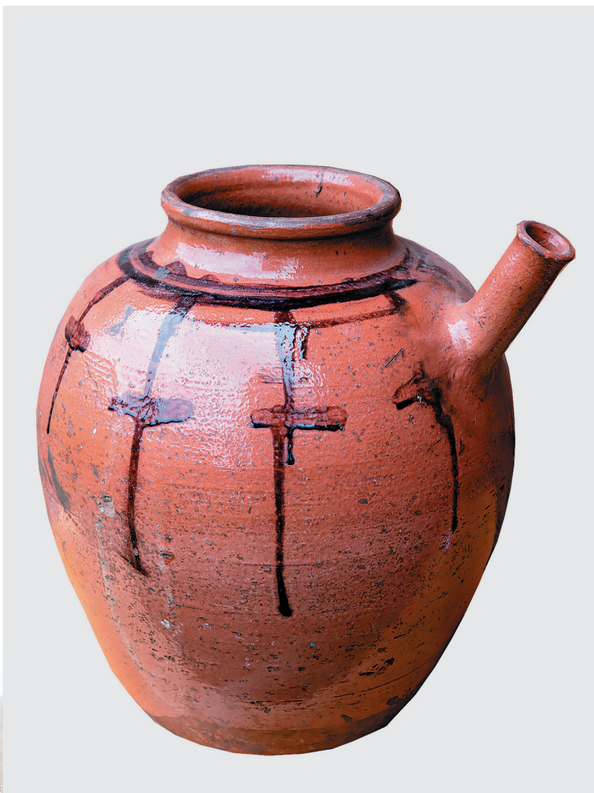
Кувшин для хранения пива с традиционной оятской росписью, начало XX века