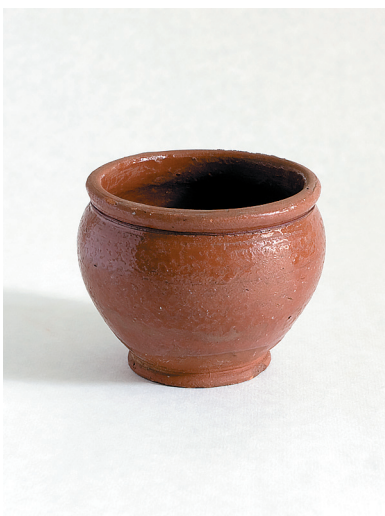
Горшок для приготовления пищи детям, 1930-е гг.