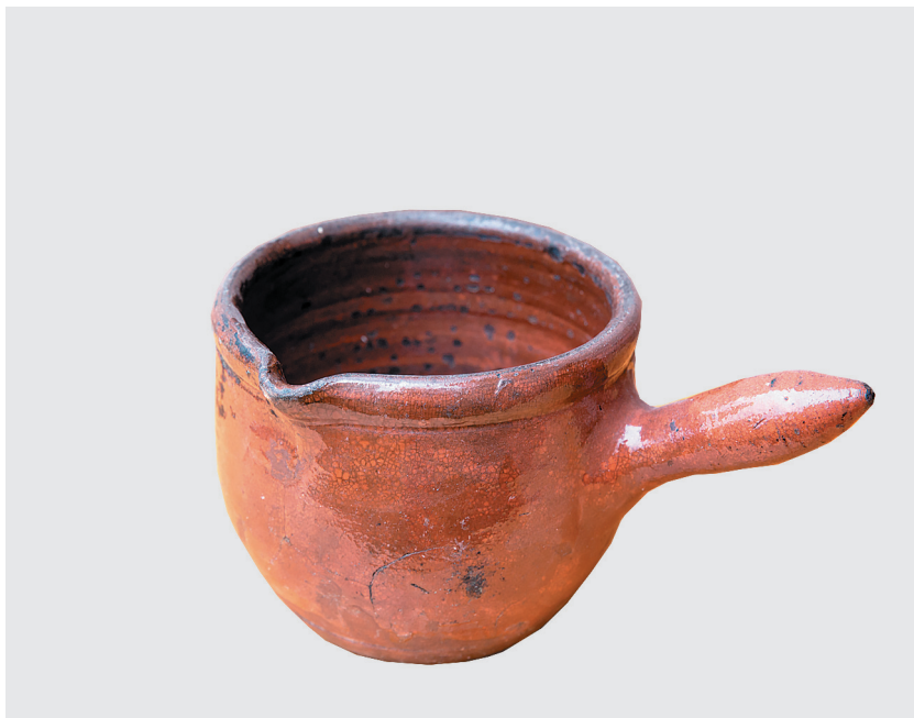
Сосуд для топления масла, первая треть XX века