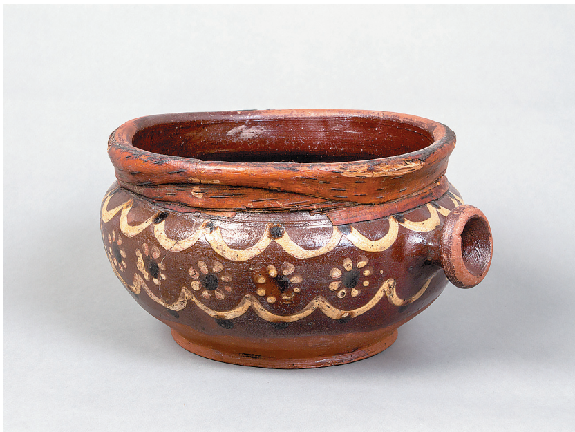
Сосуд для кваса, браги с традиционной оятской росписью, начало XX века