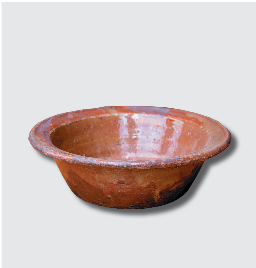
Миска, первая треть XX века