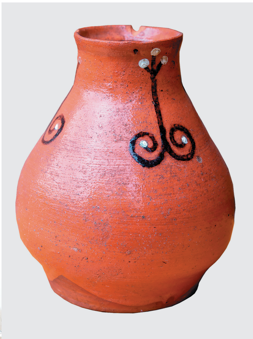
Сосуд для молока с традиционной оятской росписью, начало XX века